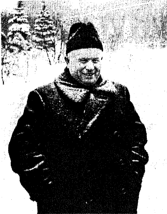
خروتشوف: لقد انتخب سكرتيراً أول للجنة المركزية للحزب الشيوعي السوفييتي بعد وفاة ستالين، وفي المؤتمر العشرين للحزب وجه ضربة قاضية للزعيم الأسطوري...